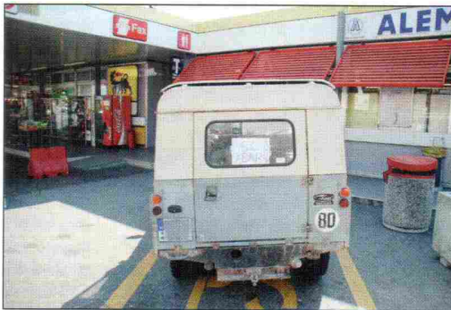
„50 years, sorry” – a kamionosok türelmetlenek voltak, mikor 70-es tempónál hosszú ideig csak a hátsónkat nézték

nehéz megtalálni a Formula-1-es pálya utcáit, ahol az éjszakai forgalmat kihasználva többször végimentünk a híres kanyarokon. Ezután már rámentünk az autópályára, de a kanyargós hegyi pályán a kopott alkatrészek miatt nagyon nehéz volt sávban tartani a kocsit.