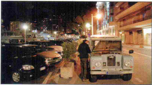
Gyors pitstop a monacói jachtklub előtt, víz-, olajsint rendben, indultunk is tovább