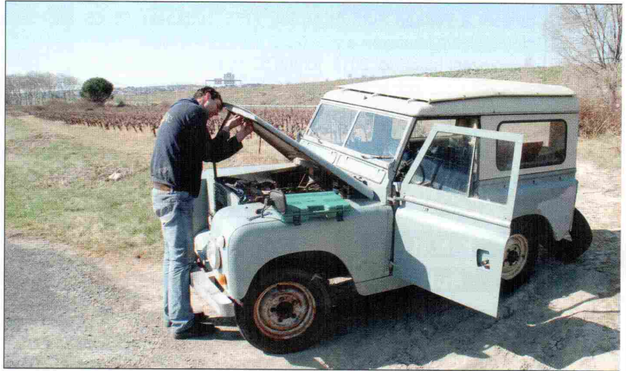
Dél-Franciaországban kis pihenő a gyönyörű szőlőfölek között

Monacóban gyönyörű utakon haladtunk, komoly kontrasztot képeztünk a jachtok és Maseratik mellett. Nem volt