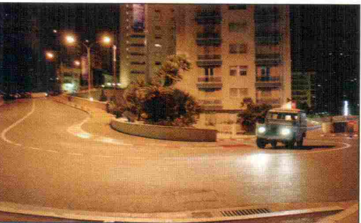
Formula-1-es pályán az öreg Landyvel